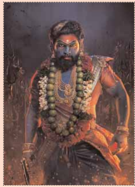
సామిరంగ మరో ఇంటర్వ్యూ అప్పేట్లు ఇచ్చారు. మరో రెండోవంద రోజుల్లో పుష్ప రూల్ బిగిన్ కాబోతుందని, విడుదల తేదీని మరోసారి కన్ఫిర్మ్ చేస్తూ 2024 ఆగస్టు 15న స్వాతంత్ర్య దినోత్సవ సందర్భంగా ఈ చిత్రాన్ని వరల్డ్ వైడ్ గా విడుదల చేయనున్నట్లు ప్రకటించారు. ప్రస్తుతం పుష్ప-2 ఫలవంతంగా మూడింగ్ జరుగుతోంది. త్వరలోనే ఈ చిత్రానికి సంబంధించిన మరొకటి ఇంటర్వ్యూ అప్పేట్లు రాబోతున్నాయి.

బకాన్ స్టార్ అల్లు అర్జున్ హీరోగా జీనియస్ డైరెక్టర్ సుకుమార్ దర్శకత్వంలో తెరకెక్కిన పుష్ప ది రైజ్.. ఎంతటి సంచలన విజయం సాధించిందో ప్రత్యేకంగా గుర్తు చేయాల్సిన అవసరం లేదు. 2021 టిగ్గెస్ట్ కమర్షియల్ ఖాక్ బస్టర్ గా నిలిచింది పుష్ప. అల్లు అర్జున్ కెరీర్ లోనే అతిపెద్ద విజయంగా నిలవడంతోపాటు.. తనకు జాతీయస్థాయి అవార్డు తెచ్చి పెట్టిన చిత్రంగా పుష్ప నిలిచింది. దీంతో దీనికి సిక్వెల్ గా తెరకెక్కుతోన్న పుష్ప-2 ద రూల్ చిత్రం పై ధారీ అంచనాలు పెరిగాయి. ఎప్పుడో వుండు ఈ సినిమా విడుదలవుతుందా అని ఆసక్తిగా ఎదురుచూస్తున్న ప్రేక్షకులకు చిత్ర యూనిట్ ఇటీవల ఈ చిత్రం విడుదల తేదీని ప్రకటించి అభిమానులకు, ప్రేక్షకులకు గుడ్ న్యూస్ అందించిన విషయం తెలిసిందే. అయితే మేకర్స్ సామిరంగ మరో ఇంటర్వ్యూ అప్పేట్లు ఇచ్చారు. మరో రెండోవంద రోజుల్లో పుష్ప రూల్ బిగిన్ కాబోతుందని, విడుదల తేదీని మరోసారి కన్ఫిర్మ్ చేస్తూ 2024 ఆగస్టు 15న స్వాతంత్ర్య దినోత్సవ సందర్భంగా ఈ చిత్రాన్ని వరల్డ్ వైడ్ గా విడుదల చేయనున్నట్లు ప్రకటించారు. ప్రస్తుతం పుష్ప-2 ఫలవంతంగా మూడింగ్ జరుగుతోంది. త్వరలోనే ఈ చిత్రానికి సంబంధించిన మరొకటి ఇంటర్వ్యూ అప్పేట్లు రాబోతున్నాయి.