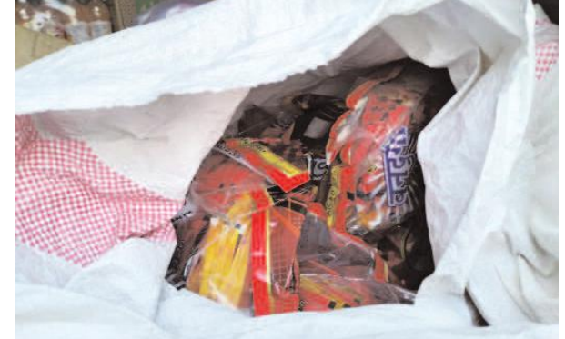
దుంబ్రుణు, డిసెంబర్ 31, మజిలీస్వామి: ఒకశా రాష్ట్రం నుంచి మందలంల గుట్కాను వ్యాపారస్తులు తరలిస్తున్నారు. ఒకశా రాష్ట్రం నుంచి చుట్టూ మీదుగా జైపూర్ రోడ్డు కూడలి ద్వారా మందలంల గుట్కా తరలిస్తున్నారు. ఒకశా నుంచి గుట్కాను దిగుమతి చేస్తూ ప్రవేటు వ్యాపారస్తులు సొమ్మును చేసుకుంటున్నారు. మందలం వ్యాప్తంగా విస్తరించిన గుట్కాను తరలిస్తున్నారు. దుకాణాలను ఆక్రమించి చేసుకుంటున్న లక్షలాది రూపాయల గుట్కా విక్రయాలి సాగుతున్నాయి. మందలం లో రాత్రి వేళలో గుట్కాను తరలింపి లక్షలాది రూపాయలను వ్యాపారస్తులు సొమ్ము చేసుకుంటున్నారు. గుట్టు చప్పుడుగా సాగు తన్ను గుట్కా తరలింపుకు అడ్డుకట్ట వేయాలని గిరిజనులు కోరుతున్నారు.