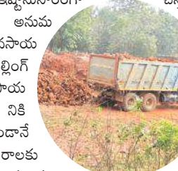
గొలగాంలో గ్రావెల్ ఫిల్లింగ్ చేస్తున్న డ్రాప్టర్లు

ఎదురుగా గల పాతతాలావిని పొరెం గ్రామానికి వెళ్ళే రహదారికి అనుకొని ఉన్న బండలను పడలకుండా ఇష్టానుసారంగా తవ్వకుని ఎటువంటి అనుమతులు లేకుండానే వ్యవసాయ రియల్టర్లు ఇష్టానుసారంగా భూముల్లో గ్రావెల్ ఫిల్లింగ్ చేస్తున్నారు. భూములకు ప్రభుత్వానికి కన్వర్షన్ చెల్లించకుండానే వ్యవసాయేతర అవసరాలకు వినియోగిస్తున్నారు. మూడు, నాలుగు అడుగుల ఎత్తు వరకు గ్రావెల్ ఫిల్లింగ్ చేసినా కనీసం పట్టణం వ్యవహారస్థులు, ఫూర్తి నిద్రావస్థలో ఉన్నారని చెప్పారు. అనకాపల్లి మండలం గొలగాం వంచాయతీ శివారు జగనన్న కాలనీకి