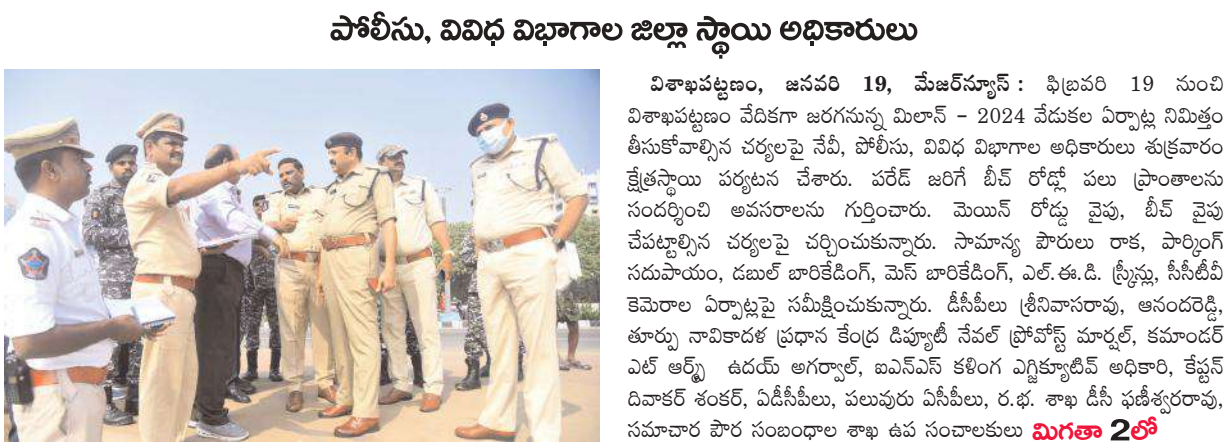
మిలన్ - 2024 ఏర్పాట్లపై అధికారుల కేంద్రస్థాయి పర్యటన

బ్యాలకేడ్లు, మెయిన్ గ్యాలరీ, పార్కింగ్ సదుపాయాల ఏర్పాట్లపై పరిశీలన-భాగస్వామ్యమైన నేటి, పోలీసు, వివిధ విభాగాల జిల్లా స్థాయి అధికారులు