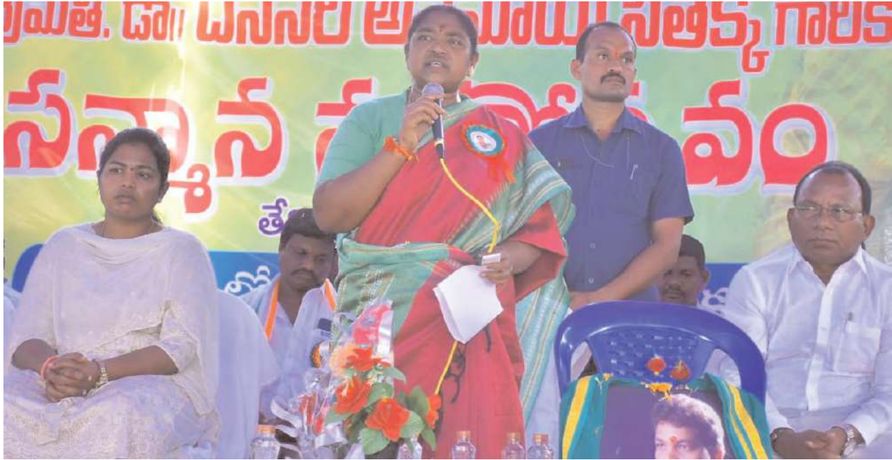
రెండు పంటలకు సాగునీరు అందించే విధంగా కృషి చేస్తూ