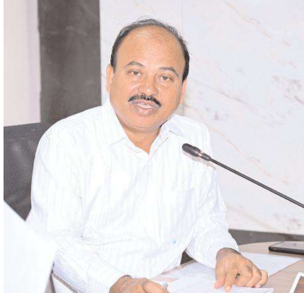
రముల నిండిన కొత్త యువ ఓటర్లకు ఎపిక్ కార్డులు అందించేందుకు చర్యలు తీసుకోవాలన్నారు. గతంలో ఓటు హక్కు కొరకు ఫారం-7, 8 లు అందజేసిన దరఖాస్తులను తగిన ఆధారాలతో పరిష్కరించాలన్నారు. ఈ సమావేశంలో మహబూబాబాద్, డోర్నల్ ఆర్డీవోలు అలివేలు, నరసింహారావు, 18 మండలాల తాసిల్దార్లు, ఉప తాసిల్దార్లు తదితరులు పాల్గొన్నారు.