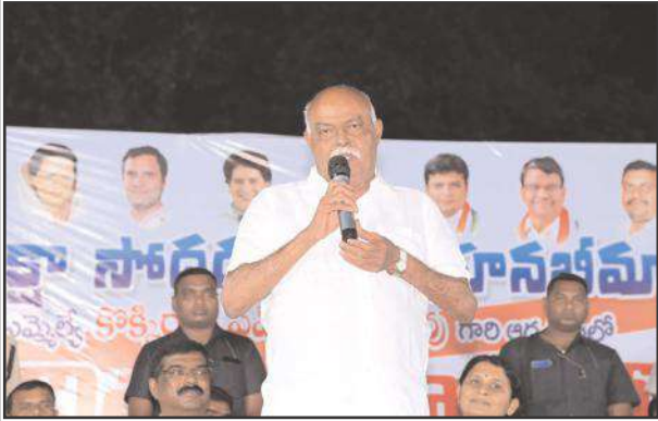
మంచీర్యాల ప్రతినిధి,ఫిబ్రవరి 11,సూర్య మేజర్ న్యూస్ :