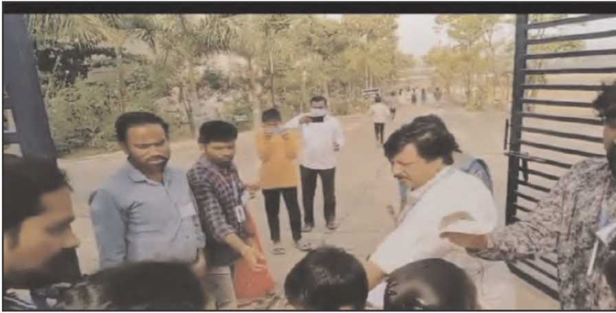
బెల్లంపల్లి టౌన్, ఫిబ్రవరి 11 సూర్య మేజర్ న్యూస్

సాంఘిక, బీసీ, గిరిజన సంక్షేమ ప్రభుత్వ గురుకులాల్లో ఐదవ తరగతి అడ్మిషన్ కోసం ఆదివారం నిర్వహించిన ప్రవేశ పరీక్ష ప్రశాంతంగా పూర్తయింది. బెల్లంపల్లి పట్టణంలో నాలుగు పరీక్ష కేంద్రాలను ఏర్పాటు చేశారు. ఉదయం 11 గంటల నుంచి మధ్యాహ్నం ఒంటిగంట వరకు పరీక్ష నిర్వహించారు. పరీక్ష రాసే అభ్యర్థులకు ఎటువంటి ఇబ్బంది లేకుండా అన్ని ఏర్పాట్లు చేసినట్లు పాఠశాలల సిబ్బంది పేర్కొన్నారు. ఈ కార్యక్రమంలో ఉపాధ్యాయులు విద్యార్థులు తదితరులు పాల్గొన్నారు.