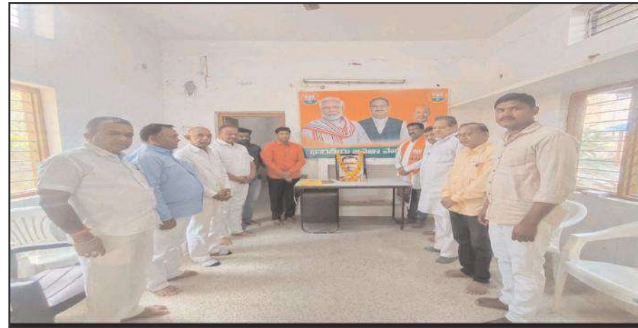
నిర్మల్ ఫిబ్రవరి 11, సూర్య మేజర్ న్యూస్