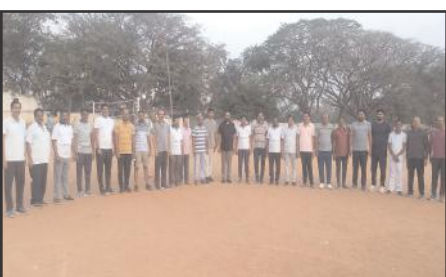
నిర్మల్, ఫిబ్రవరి 14, సూర్య మేజర్ న్యూస్