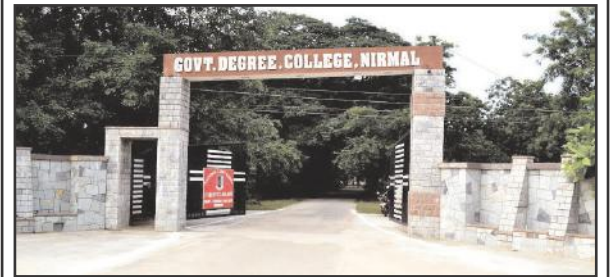
ఖానాపూర్ ,ఫిబ్రవరి14,సూర్య మేజర్ న్యూస్

ఖానాపూర్లో డిగ్రీ కళాశాల కలగానే ఉండేలా వుంది. బిఆర్ఎస్ ప్రభుత్వములో ఖానాపూర్లో డిగ్రీ కళాశాల ఏర్పాటు సాధ్యము కాలేదు మరి ప్రభుత్వము మారిన ఖానాపూర్ కి డిగ్రీ కళాశాల కలగానే వుండేలా వుంది. ఈ సంవత్సరం ఏప్రిల్ 1 కల్లా అన్ని జూనియర్ కళాశాలల పరీక్షలు ముగిస్తాయి. వచ్చే విద్యా సంవత్సరం వరకు అయిన ఖానాపూర్ తో పాటు చుట్టూ పక్క ఆయా మండలాల విద్యార్థులకు ఎంతో ఉపయోగపడే డిగ్రీ కళాశాల సాధ్యం అవుతుంది అని ఆశిద్దాం. ఎమ్మెల్యే వెడ్ల బొజ్జ చౌరవ తీసుకుని వచ్చే విద్యాసంవత్సరం వరకు అయిన డిగ్రీ మొదటి సంవత్సరం తరగతులు ప్రారంభం అయిల కృషి చేయాలని విద్యార్థులు, వారి తల్లిదండ్రులు కోరుతున్నారు. ఇంటర్ పూర్తి చేసుకుని డిగ్రీ చేయబోయే పేద విద్యార్థులకు ప్రభుత్వ డిగ్రీ కళాశాల ఎంతో ఉపయోగకరంగా వుంటుందని పలువురు నాయకులు అంటున్నారు. ఎమ్మెల్యే , ఉన్నతాధికారులు స్పందించి ఖానాపూర్లో వచ్చే విద్యాసంవత్సరం వరకైనా కళాశాల ఏర్పాటు చేయాలని పలు విద్యార్థి సంఘాలు కోరుతున్నాయి.