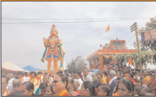
సోన్, ఫిబ్రవరి14,సూర్య మేజర్ న్యూస్:

మండలంలోని కర్డార్ గ్రామంలో బుధవారం వీరాంజనేయ స్వామి విగ్రహ ప్రతిష్ఠాపన వైభవంగా నిర్వహించారు. గ్రామంలో జైశ్రీరామ్.. జై హనుమాన్ నినాదాలతో మారు మోగింది. వసంత పంచమిని పురస్కరించుకొని గ్రామ గల్ఫ్ కమిటీ ఆధ్వర్యంలో ఏర్పాటుచేసిన 23 అడుగుల శ్రీశ్రీ వీరాంజనేయ స్వామి భారీ విగ్రహ ప్రతిష్ఠాపన కార్యక్రమాన్ని అంగరంగ వైభవంగా నిర్వహించారు. ఈ సందర్భంగా ప్రత్యేకంగా అలంకరించిన పల్లకిలో స్వామివారి ఉత్సవ విగ్రహాన్ని బాజా భజంత్రీల నడుమ