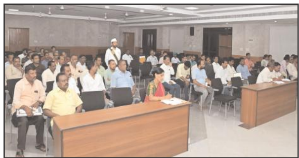
అధికారులు తదితరులు పాల్గొన్నారు.