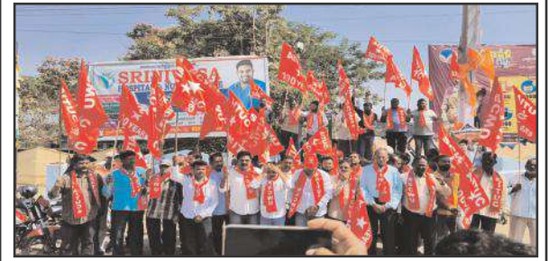
మందమర్రి టౌన్, ఫిబ్రవరి 16, సూర్య మేజర్ న్యూస్.