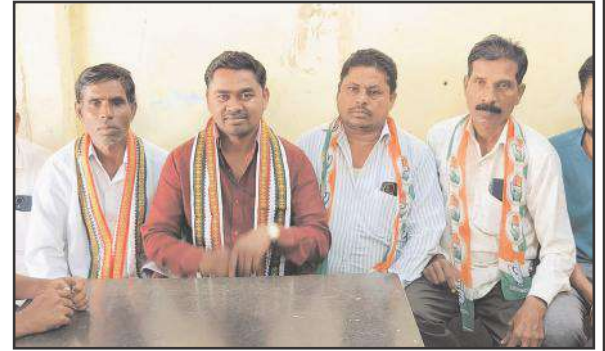
ఇంద్రవెల్లి, ఫిబ్రవరి 17, సూర్య మేజర్ న్యూస్