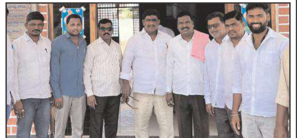
కాగజ్ నగర్ టౌన్, ఫిబ్రవరి 17, సూర్య మేజర్ న్యూస్