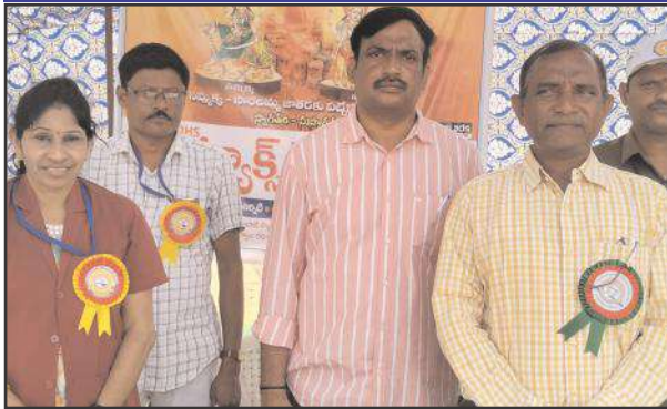
మంచిర్యాల టౌన్, ఫిబ్రవరి 20, సూర్య మేజర్ న్యూస్: