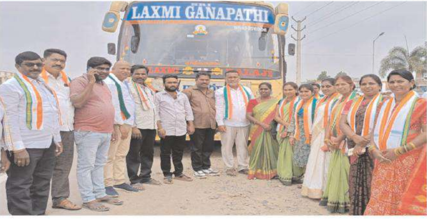
మందమర్రి టౌన్, ఫిబ్రవరి 2, సూర్య మేజర్ న్యూస్.