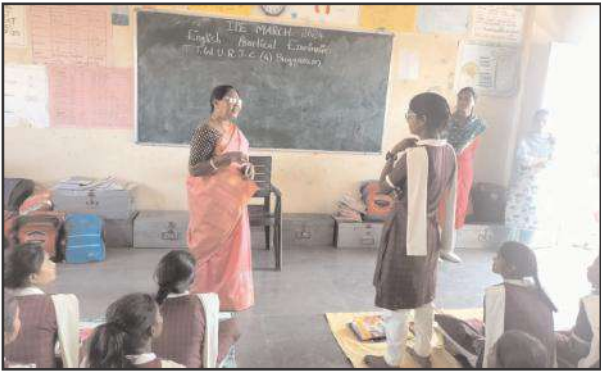
నేరడిగొండ ఫిబ్రవరి 22 సూర్య మేజర్ న్యూస్