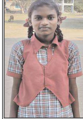
శ్రీరాంపూర్, ఫిబ్రవరి 23, సూర్య మేజర్ న్యూస్: