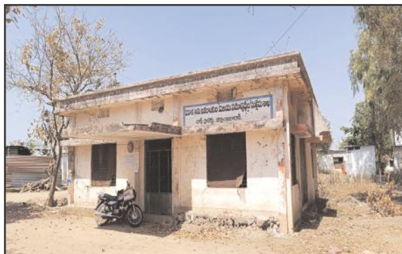
మూతపడ్డ ఐ.సి.డి.ఎస్ కార్యాలయం

ఇంత జరుగుతున్నా పాలకులు వ్యవహారాన్ని తీరు చిత్రంగా ఉందని పాలకుల నిర్లక్ష్యం ఇక్కడ ప్రాంత ప్రజలకు శాపంగా మారిందని ప్రజలు బహిరంగంగానే తమ ఆవేదనను వ్యక్తం చేస్తున్నారు. ఇప్పటికైనా పాలకులు ఈ ప్రాంతం అభివృద్ధి పైన దృష్టి పెట్టి ఇతర ప్రాంతాలతో సమానంగా ఇక్కడ కూడా ప్రజలకు విద్యా, వైద్య, రోడ్డు రవాణా వసతులు కల్పించాలని ఇక్కడి ప్రజలు ప్రజా ప్రతినిధులను కోరుతున్నారు. ఈ ప్రాంతం నుంచి తరలించిన ప్రభుత్వ కార్యాలయాలను తిరిగి ఇక్కడే ఏర్పాటు చేసి పక్క భవనాలను నిర్మించాలని, అలాగే ఇక్కడి నుంచి వేరే ప్రాంతాల్లో ఉన్న కళాశాలలను తిరిగి ఇదే ప్రాంతంలో నిర్మించాలని ప్రజలకు విద్య వైద్యానికి సంబంధించిన అన్ని రకాలైన సౌకర్యాలు అభివృద్ధి చేయాలని ఇక్కడి ప్రజలు కోరుతున్నారు.