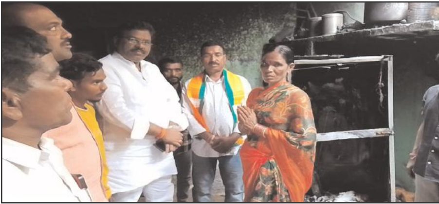
రామకృష్ణాపూర్, ఫిబ్రవరి 25, సూర్య మేజర్ న్యూస్