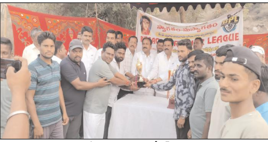
ఖైంసా, ఫిబ్రవరి 25, సూర్య మేజర్ న్యూస్