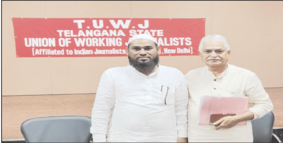
ఆసిఫాబాద్ ప్రతినది 25 ఫిబ్రవరి సూర్య మేజర్ న్యూస్