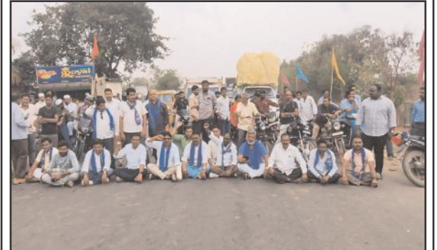
రాస్తా రోకో చేస్తున్న బీఎస్పీ నాయకులు

.... మహనీయుల విగ్రహాల ధ్వంసం దుండగులను శిక్షించాలని డిమాండ్