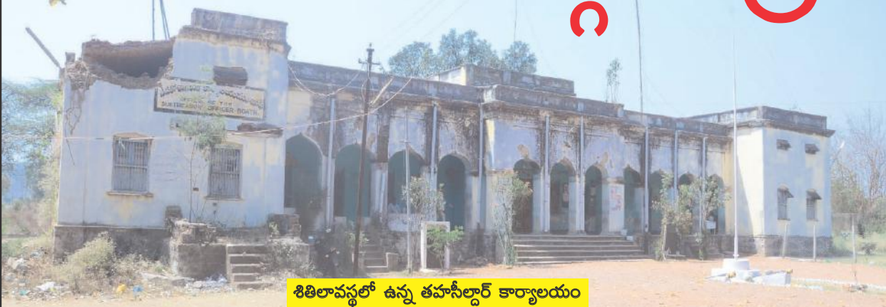
శిలాలవస్థలో ఉన్న తహసీల్దార్ కార్యాలయం