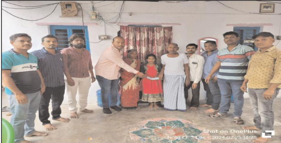
శ్రీరాంపూర్, ఫిబ్రవరి 25, సూర్య మేజర్ న్యూస్: