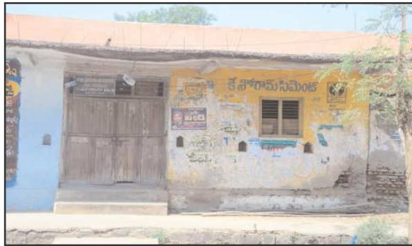
అద్దె భవనంలో గ్రంథాలయం

నియోజకవర్గ కేంద్రమైన బోధ మండలంలో దాదాపుగా చాలావరకు ప్రభుత్వ భవనాలన్నీ అద్దెభవనాల్లోనే కొనసాగడం