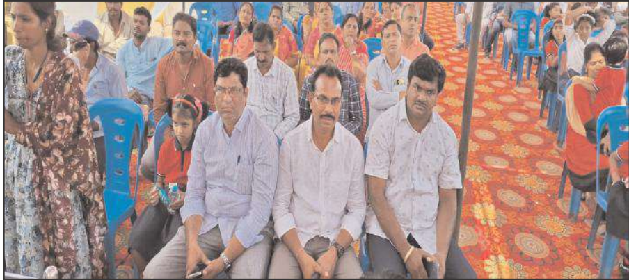
కాగజ్ నగర్, 26 ఫిబ్రవరి, సూర్య మేజర్ న్యూస్: