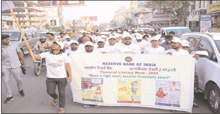
మంచుర్యాల ప్రతినిధి, 27 ఫిబ్రవరి, సూర్య మేజర్ న్యూస్