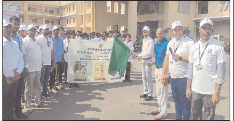
ఆసిఫాబాద్ ప్రతినిధి, 27 ఫిబ్రవరి, సూర్య మేజర్ న్యూస్