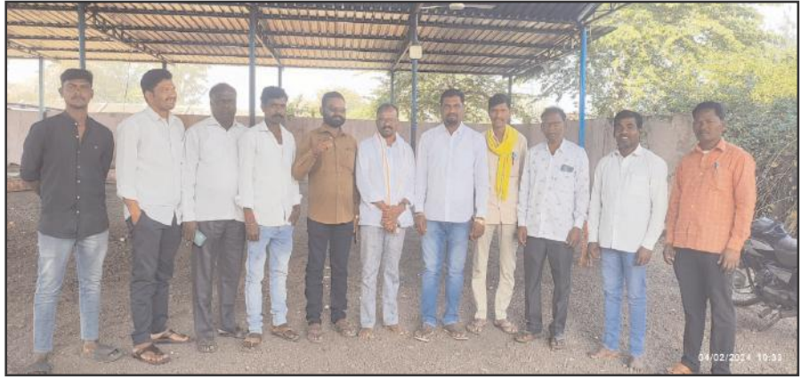
బోధ్, ఫిబ్రవరి 04, సూర్య మేజర్ న్యూస్