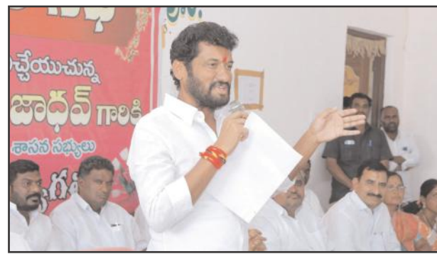
పార్టీలు కలిసి నియోజకవర్గం పలువురు వాపోతున్నారు.

నాయకులపై మంట రాజేశారు. వీటికి అరికర పార్టీ ఏమైనా స్వీకరిస్తుందా లేదా ఇక్కడితోని వదిలేస్తుందా. రాష్ట్రం వాళ్లదైనా నియోజకవర్గం మాదే అంటూ బిఆర్ఎస్ ఎమ్మెల్యే ఇంద్రరెక్కగానే సవాల్ ఇన్ డైరెక్ట్ ఏంటి డైరెక్ట్ గానే విసిరారు అధికార పార్టీ అయినా కాంగ్రెస్ పార్టీ నాయకుల హవా నియోజకవర్గంలో సాగదా తాగనివ్వరా సాగుతుందా. రాజకీయయుద్ధంగా చూడకుండా నియోజకవర్గం అధికార ప్రతిపక్ష