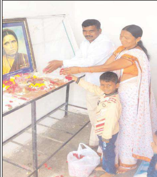
గుడిహత్తుర్,ఫిబ్రవరి 07