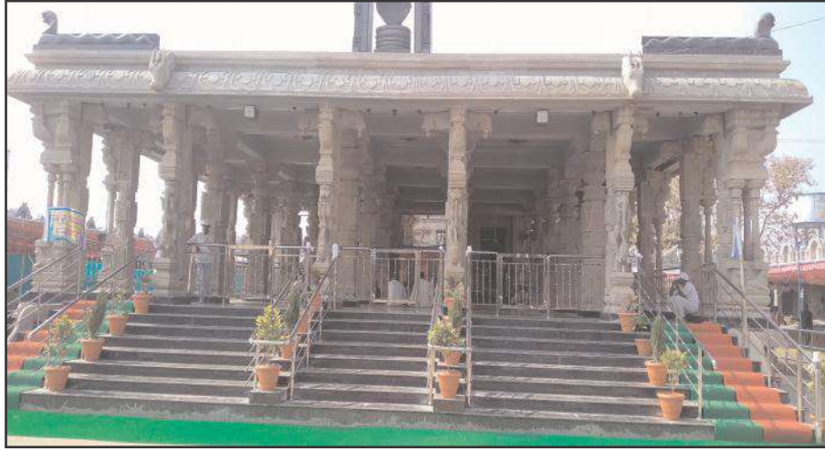
ఇంద్రవెల్లి, ఫిబ్రవరి 07, సూర్య మేజర్ న్యూస్

ఆసియా ఖండంలోనే అతిపెద్ద రెండవ గిరిజన జాతరగా పేరుపొందిన మెస్రం వంశీయుల ఆరాధ్య దైవం నాగోబా జాతర ప్రతి ఏటా అమావాస్య రోజున ఆదివాసీల సంస్కృతి సంప్రదాయాల ప్రకారం అర్ధ రాత్రి మహాపూజలతో మెస్రం వంశీయులు జాతర ప్రారంభిస్తారు. ఈ ఏటా కూడా ఆదివాసీల సంస్కృతి సంప్రదాయాల ప్రకారం ఈ నెల 9 తేదీ నుండి ప్రారంభమై నాగోబా జాతర ప్రారంభానికి