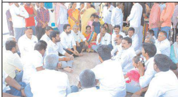
తలమడుగు,ఫిబ్రవరి07,సూర్య మేజర్ న్యూస్

ప్రతి ఒక్కరు భక్తి మార్గంలో నడవాలని ఎమ్మెల్యే అనిల్ జాదవ్ కోరారు. తలమడుగు మండలంలోని సుంకిడి గ్రామంలో అయ్యప్ప స్వామి ఆలయంలో కుచులాపూర్ మాజీ సర్పంచ్ ప్రత్యేక పూజలు నిర్వహించి అన్నదాన కార్యక్రమం చేపట్టారు. ఈ కార్యక్రమానికి ముఖ్యఅతిథిగా ఎమ్మెల్యే అనిల్ జాదవ్ హాజరు కావడం జరిగింది.