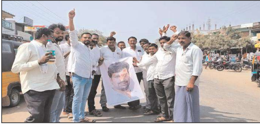
బోధ్ ,ఫిబ్రవరి07,సూర్య మేజర్ న్యూస్