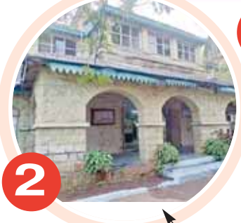
2 డీఆర్ డీపీ కార్యాలయం