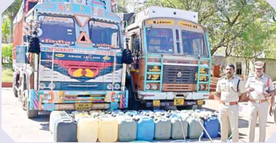
డీజిల్ క్యాన్లు, వందల మీటర్లు గల పైపు కట్టలు వెంట తీసుకొస్తారు.

నేపథ్యం : ఈ ముఠాలోని సభ్యులందరూ ఒకే ప్రాంతానికి చెందిన వారు. వీళ్లలో అధికంగా సమీప బంధువులే. కూలీ పనులు, డ్రైవర్ వృత్తి వల్ల వచ్చే సంపాదనతో తృప్తి పడకుండా సులువుగా డబ్బు సంపాదించాలనే దురాశతో నేరాలకు ఒడిగట్టారు. ముఖ్యంగా శివారు ప్రాంతాల్లోని పెట్రోలు బంకులు, టైర్ స్టాక్ గోడౌన్లను టార్గెట్ చేస్తారు. నెల లేదా 20 రోజులకని బాడుగకు మాట్లాడుకుని 12 వీలర్ల లారీలను రెండింటిని ఉస్మానాబాద్ ప్రాంతంలో అద్దెకు తీసుకుని రాబరీలు, దొంగతనాలు చేసేందుకు మహారాష్ట్రలో పాటు కర్నాటక, ఆంధ్రప్రదేశ్ రాష్ట్రాలకు వస్తారు. ఈ లారీలతో పాటు డీజిల్ తోడేందుకు 2 చేతి పంపులు,