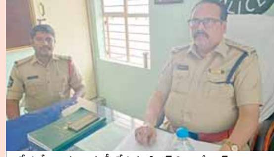
స్టేషన్లో రికార్డులు తనిఖీ చేస్తున్న డి.ఎస్.పి బాబీ జాన్ సైదా, ఎస్సై వీరేష్

అగళి మేజర్ న్యూస్: స్థానిక పోలీసు స్టేషన్ ను పెనుగొండ డి.ఎస్.పి. బాబీ జాన్ సైదా ఆదివారం తనిఖీ చేశారు. ఈ సందర్భంగా ఆయన స్టేషన్ లోని రికార్డులను పరిశీలించి పెండింగ్ కేసుల వివరాలపై ఆరా తీశారు. అగళి మండలం కర్ణాటక సరిహద్దులో ఉన్నందున బార్డర్ లో పెట్రోలింగ్ నిర్వహించాలని, అదేవిధంగా మండల కేంద్రమైన అగళి లో రాత్రి గస్తీ తిరగాలని, శాంతి భద్రతలకు ఎలాంటి విఘాతం కలగకుండా చర్యలు తీసుకోవాలని పోలీసులకు సూచించారు. అనంతరం ఆయన విలేజరులతో మాట్లాడుతూ సామాజిక ఎన్నికలు సమీపిస్తున్న తరుణంలో ఇదివరకే బ్యూడిగెర్ వర్గ్ చెక్ పోస్ట్ ను ఏర్పాటు చేసి అక్రమ కర్ణాటక మద్దం రవాణా, ఎలాంటి రసీదులు లేకుండా అధిక మొత్తంలో డబ్బులు తరలిస్తే సీజ్ చేస్తామన్నారు. అగళి మండలానికి అనుకొని ఉన్న కర్ణాటక బార్డర్లో బొమ్మరసపల్లి, అలూడి, పూలపల్లి, నందరాజన పల్లి తదితర గ్రామాలలో త్వరలో చెక్ పోస్ట్ లను ఏర్పాటు చేస్తామన్నారు. గ్రామాలలో ఎక్కడైనా మట్టా, పేకాట, ఇసుక అక్రమ రవాణా, చోరీలు, కర్ణాటక మద్దం విక్రయాలు నిర్వహించిన, ప్రోత్సహించిన అట్టిపాటి పై తనిఖీ నిర్వహించి అరెస్టు చేసి కఠిన చర్యలు తీసుకుంటామని డిఎస్పి బాబీ జాన్ సైదా తెలిపారు. మండలంలో అర్రరాత్రి అపరిచితులు కొత్త వ్యక్తులు ఎవరైనా అనుమానంగా తిరుగుతూ ఉంటే ఎవరైనా తచ్చాడు తూ