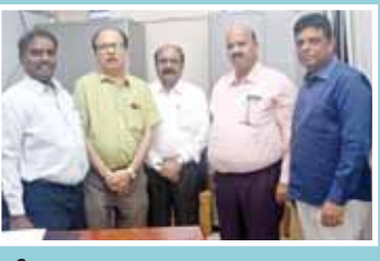
ఏపీ ఈసెట్ -2024 కన్వీనర్ గా