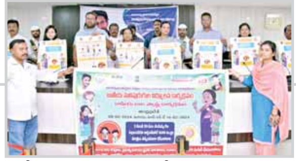
ఆరోగ్యవంతమైన పిల్లల కోసం