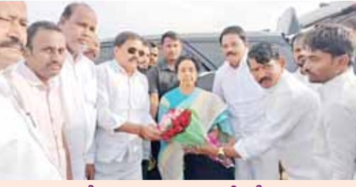
నారా భువనేశ్వరికి ఘనంగా వీడ్కోలు పలికిన