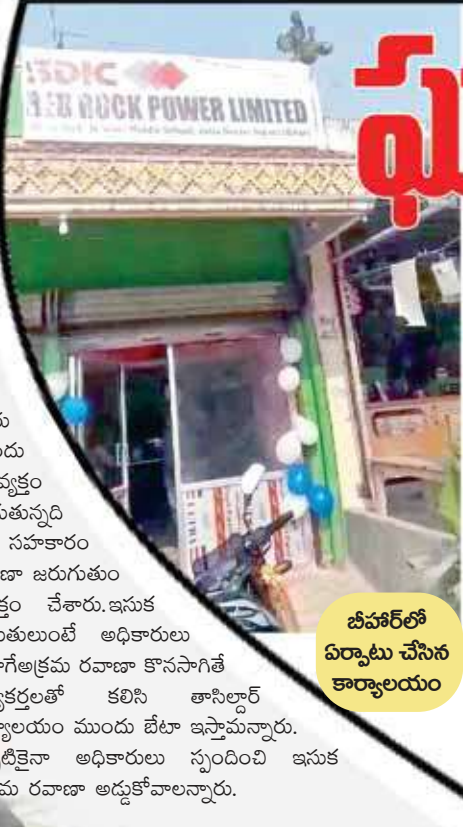
బీహార్లో ఏర్పాటు చేసిన కార్యాలయం