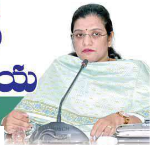
జిల్లా కలెక్టర్ యం. గౌతమి

రాజకీయ పార్టీల ప్రతినిధులు క్షేత్రస్థాయిలో ఏ సమస్య ఉన్నా అధికారుల దృష్టికి తీసుకురావాలి