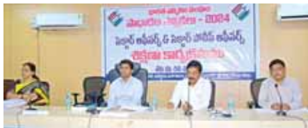
జిల్లా కలెక్టర్ అరుణ్ బాబు