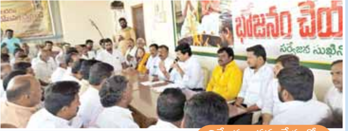
ప్రజల సొమ్మంతా బినామీ కంపెనీలకే!!

గందరగోళంలో పడ్డారు. అయితే వీటన్నిటికీ కాలమే సమాధానం చెబుతుందన్నది నగ్గు సత్యంగా కళ్యాణదుర్గం తెలుగుదేశం పార్టీ కార్యకలాపాలే ఇందుకు నిదర్శనం అని చెప్పవచ్చు. నిన్న మొన్నటి వరకు తెలుగుదేశం పార్టీ ఉన్న వర్గం వర్సెస్ ఉమామహేశ్వర్ నాయుడు వర్గాల మధ్య వచ్చి గడ్డి వేస్తే భగ్గుమన్న స్థాయిలో కార్యకలాపాలు జరిగాయి. అందుకు చాలా చాలా రకాలుగా ఉదాహరణలు ఉన్నాయని నియోజకవర్గ ప్రజలకు తెలిసింది. అయితే కొన్ని సమస్యలకు కాలమే సమాధానం చెబుతుంది అనేది నిజం అయితే కళ్యాణదుర్గం నియోజకవర్గం లో గత 40 సంవత్సరాలుగా తెలుగుదేశం పార్టీని అంటిపెట్టుకొని అష్ట కష్టాలు పడుతూ పార్టీ కార్యకర్తలను కాపాడుకుంటూ వచ్చి అనేకమైన