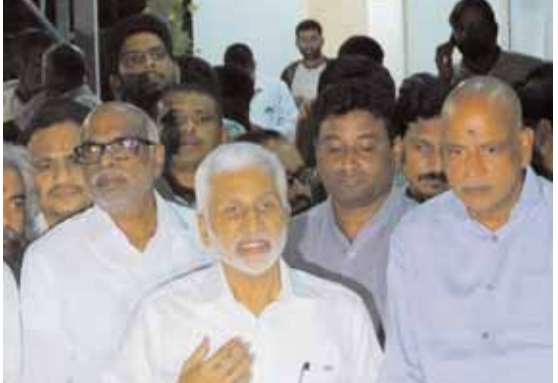
ఏ పార్టీని వదలకుండా అందరినీ కలుపుకు పోవాలన్నారు. పార్టీ కమిటీలను త్వరగా పూర్తి చేయాలన్నారు. గత ఎన్నికల్లో గెలుపుకు పార్టీ బూత్ కమిటీలు కీలకంగా వ్యవహరించాయన్నారు. ఇప్పటికీ బూత్ కమిటీలు పూర్తి కాని నియోజకవర్గాలు త్వరగా పూర్తి చేసుకోవాలన్నారు. రానున్న 50 రోజులు ఎన్నికల కీలకం కావున అప్రమత్తంగా ఉండాలన్నారు. గడవ గడవకు మన ప్రభుత్వం లాంటి కార్యక్రమాలతో నిత్యం ప్రజల్లోనే ఉండాలని చెప్పారు. టీడీపీ అనుకుల మీడియా కుట్రలను తిప్పికొట్టాలి. రాష్ట్రంలో అభివృద్ధి జరగడం లేదు. అమరావతి రాజధానికి వైఎస్ఆర్ కాంగ్రెస్ పార్టీ వ్యతిరేకం అంటూ టీడీపీ, దానికి అనుకులంగా వ్యవహరించే మీడియా చేస్తున్న కుట్రలను తిప్పికొట్టాలని, ఈ విషయాల్ని ప్రతి సమావేశంలో ప్రస్తావించి ప్రజలకు తెలియజేయాలన్నారు. మనం రాజధానిని తరలించడం లేదు. అన్ని ప్రాంతాల అభివృద్ధి చెందాలన్నది జగన్ అభిమతం అన్న విషయాన్ని అందరికీ తెలియ

గుంటూరు, సూర్య ప్రధాన ప్రతినధి : రానున్న ఎన్నికల్లో గుంటూరు పార్లమెంట్ స్థానంలో పాటు ఏడు అసెంబ్లీ నియోజకవర్గాలు గెలుపే లక్ష్యంగా పని చేయాలని పార్టీ నాయకులకు వైఎస్ఆర్ కాంగ్రెస్ పార్టీ రీజనల్ కోఆర్డినేటర్, రాజ్యసభ సభ్యులు విజయసాయిరెడ్డి అన్నారు. గుంటూరు పార్లమెంట్ పరిధిలోని ఎమ్మెల్యేలు, ఎమ్మెల్యేలు, నియోజకవర్గ సమన్వయ కర్తలు, పరిశీలకులతో గుంటూరు పార్టీ ప్రాంతీయ కార్యాలయంలో మంగళవారం సమావేశం నిర్వహించారు. ఈ సమావేశంలో విజయ సాయిరెడ్డి మాట్లాడుతూ గుంటూరు, నరసరావుపేట, బాపట్ల నియోజకవర్గాల పార్టీ రీజనల్ కోఆర్డినేటర్ గా నన్ను నియమించిన ముఖ్యమంత్రికి హృదయపూర్వక ధన్యవాదాలు తెలిపారు. జగన్ నాలుగవేళ్లకు పైగా సాగించిన పాలనలో ప్రజల సంక్షేమమే పరమావధిగా విజ్ఞప్తికాస్తున్న మార్పులు తీసుకొచ్చి ప్రజల సంక్షేమమే అనిపించినట్లు అన్నారు. దీన్ని మనం ఎన్నికల్లో అనుకూలంగా ఉపయోగించుకోవాలని అన్నారు. పార్లమెంట్, అసెంబ్లీ అభ్యర్థుల ఎంపిక విషయంలో ముఖ్యమంత్రి వైఎస్ జగన్ సామాజిక న్యాయం పాటించారని అన్నారు. నియోజకవర్గాలలో ఇంచార్జీలను మార్పు చేసి, కొత్తవారికి అవకాశాలు ఇస్తున్నారని అన్నారు. పార్టీ పెట్టినప్పటి నుండి, 2014లో ఓటమి తరువాత ప్రతి పక్షపార్టీల నుండి అనేక దారులను ఎదుర్కొన్నామని అన్నారు. ఈ పార్లమెంటు పరిధిలోని ఏడు నియోజక వర్గాలలో గెలుపు కోసం ప్రణాళికతో ముందుకెళ్ళామని పిలుపునిచ్చారు. గెలుపు కోసం పార్టీ కార్యకర్తలను కలుపుకోని వారితో అభివృద్ధి భావం లేకుండా పోరోసా కల్పించాలని బాధ్యత పార్టీ ఎమ్మెల్యేలు, సమన్వయకర్తల మీద ఉంచాలన్నారు. ఉద్యోగులు, ఎస్సీ, ఎస్టీ