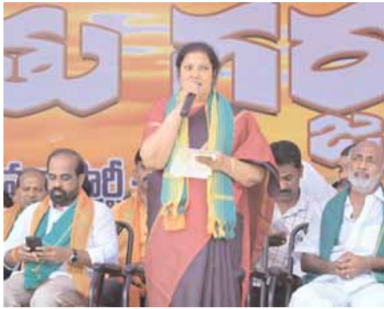
అమరావతి, సూర్య ప్రత్యేక ప్రతినధి : ముఖ్యమంత్రి జగన్ విజయవాడ రైతుల వక్రపాతి అయితే వారంకాం ఎందుకంటే న్యూఢిల్లీలో ఉన్నారని బీజేపీ రాష్ట్ర అధ్యక్షురాలు దగ్గుబాటి పురుందేశ్వరి ప్రశ్నించారు. తమ ఎన్నికల మేనిఫెస్టోను బదిలీ గ్రామంగా ప్రచారం చేసుకుంటున్న సీఎం రైతులకు ఇచ్చిన వాగ్దానాలను విస్మరించి అవమానించిన మాట వాస్తవం