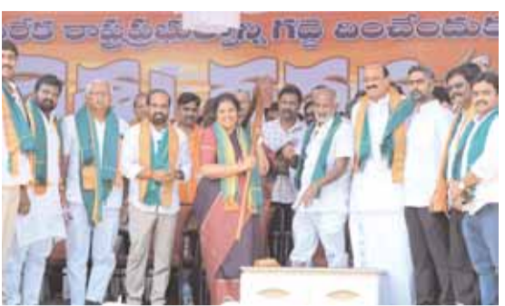
యాంత్రికరణ అటకెక్కించారని, ప్రకృతి వైపరీత్యాల సమయంలో ముందున్న జాగ్రత్తలను సూచించే వాతావరణం కూడా రాష్ట్రంలో లేకుండా పోయిందని ఆవేదన వ్యక్తం చేశారు. కేంద్ర ప్రభుత్వం ఏడు సాగునీటి ప్రాజెక్టులను ప్రాధాన్యత క్రమంలో తీసుకొని వాటి పూర్తికి సహకరిస్తామని ముందుకొచ్చినా సమగ్ర ప్రాజెక్టు నివేదిక పంపించే తీరిక కూడా జగన్ సర్కారు లేదని విమర్శించారు. వెలిగొండ ప్రాజెక్టు పూర్తి కాకుండానే జాతీయ అంకితం చేస్తున్నట్లు తన సొంత పత్రికల్లో ప్రకటనలు చేసుకోవడం సిగ్గుచేటుగా ఉందని, పోలవరం ప్రాజెక్టు కింద అంచనాలు పెంచి నిధుల కోసం కేంద్రానికి వినతులు ఇస్తున్నారని, కేంద్రం నుంచి రూ. 55 వేల కోట్ల నిధులు మంజూరైతే, అందులో పది వేల కోట్ల రూపాయలను కాజీన్ ప్రయత్నం చేస్తున్నారని ఆరోపించారు. టే టాక్స్ పేరిట అందరిపై అదనపు భారం మోపుతున్నారని మాజీ మంత్రి కామిషనీ శ్రీనివాసరావు విమర్శించారు.

కాదా? అని నిలదీశారు. ప్రతి ఒక్కరి నెత్తిన రూ. 2.5 లక్షల అప్పు ఉంచారన్నారు. విజయవాడలో భారతీయ జనతా పార్టీ కిసాన్ మోర్చా ఆధ్వర్యంలో నిర్వహించిన రైతు గగ్గెన సభలో ఆమె ప్రభుత్వంపై విమర్శలు గుప్పించారు. జిజీఎస్ నోక్సి నిధులు లాగేసుకుంటున్నారు. విత్తనం నుంచి మార్కెటింగ్ వరకు రైతులను ముందుండి నడిపిస్తామని జగన్ అధికారంలోకి రాకముందు చేసిన ప్రసంగాలకు వాస్తవాలకు మధ్య తీవ్రమైన వ్యత్యాసం ఉంది. అత్యుహత్యల్లో రాష్ట్రం దేశంలోనే మూడో స్థానంలో నిలవడం అత్యంత ఆవేదన కలిగిస్తోంది. ప్రకృతి వైపరీత్యాల సమయంలో సత్కారాలు వ్యవసాయ దారులను ఆదుకోలేదు. ధరల స్థిరీకరణ, విపత్తుల నిధులు ఏమయ్యాయి?. నీటిపారుదల ప్రాజెక్టులపై రాష్ట్ర ప్రభుత్వానికి క్రెడెట్ లేదు. అస్సలుమయ్య ప్రాజెక్టు నిర్మాణాలకు నేటికీ న్యాయం చేయలేకపోయారు. కేంద్ర ప్రభుత్వం జాతీయ ఉపాధి హామీ పథకం కింద విడుదల చేస్తోన్న నిధులతో కనీసం సాగునీటి కాలువ మరమ్మత్తులు కూడా చేయించలేని దయనీయ పరిస్థితిలో పాలన సాగుస్తున్నారని. తనకున్న అలవాటు ప్రకారం జిజీఎస్ నోక్సి చివరికి రైతులకు కేంద్రం ఇస్తోన్న నిధులను కూడా లాగేసుకుంటున్నారని మండిపడ్డారు. రాష్ట్రంలో జగన్ మోహన్ రెడ్డి రైతులను కూడా అరికట్టి చేస్తూ దుర్మార్గ పాలన సాగుస్తున్నారని బీజేపీ జాతీయ కార్యదర్శి వై.సత్యకుమార్ ధ్వజమెత్తారు. వ్యవసాయ రుణాలు సక్రమంగా ఇవ్వడంలేదని,