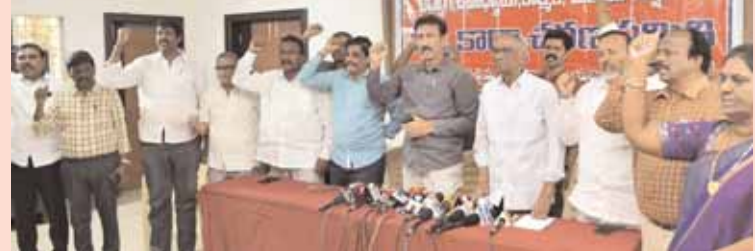
సమస్యలు పరిష్కారం అయ్యేవరకు విశ్రమించేది లేదన్నారు. ప్రభుత్వం చర్చలకు పిలిచిన ప్రతిసారి కేవలం మాటలే తప్ప ఒక్క సమస్యను కూడా సంతృప్తంగా పరిష్కరించలేదన్నారు.

హాజరవుతున్నారు. తహసీల్దార్, సబ్ కలెక్టర్, కలెక్టర్లకు వినతి పత్రాలను సమర్పణ, 15, 16 తేదీల్లో నల్ల బ్యాజ్ లో ధరించి మధ్యాహ్నం తోజన విరామ సమయంలో తాలూకా కేంద్రాలు, పాఠశాలల్లో నిరసన కార్యక్రమాలు, 17వ తేదీన తాలూకా కేంద్రాల్లో రాల్పిలు, ధర్నా చేపట్టడం, 20వ తేదీన జిల్లా కలెక్టర్ కు వద్ద రాల్పి, ధర్నా నిర్వహణ, 21 నుంచి 24 వరకు రాష్ట్ర నాయకులు అన్ని జిల్లాల్లో పర్యటింపి 27వ తేదీన చేపట్టేస్తున్న చలో విజయవాడకు ఉద్యోగులను సిద్ధం చేసేమని చెప్పారు. ఈసారి జరిగే ఉద్యమం ద్వారా ఇప్పటివరకు అవసరమైనంతగా ఉన్న అన్ని