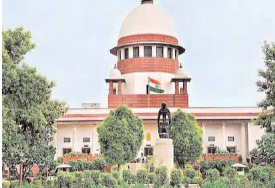
వెలగపూడి, సూర్య ప్రధాన ప్రతినధి : దేశంలో త్వరలో జరగనున్న సూర్య ప్రతినధి ఉన్నప్పుడు నేపథ్యంలో ఓటర్ల తుది జాబితా 2024 రూపొందించేందుకు భారత ఎన్నికల సంఘం అనుసరిస్తున్న ప్రక్రియ పట్ల సంతృప్తిని వ్యక్తం చేస్తూ సంవిధాన్ బచావో ట్రస్టు సుప్రీమ్ కోర్టు