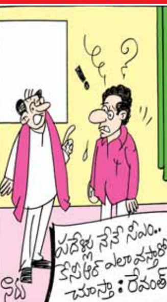
ఆరు గ్యారంటీలతో పాటు ఈ గ్యారంటీని సీనియర్లు ఇచ్చారేమో