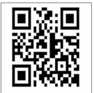
సూర్య ఈ - పేపర్