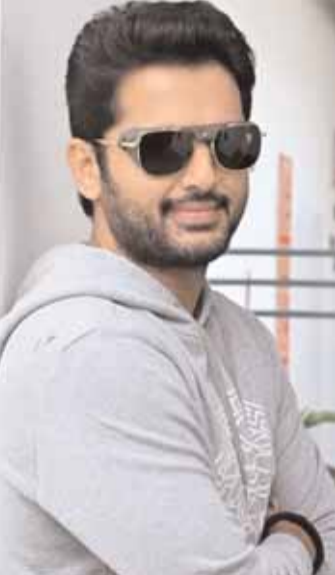
హీరో నితీష్, టాలెంటెడ్ మేకర్ వెంకీ కుడుములతో చేస్తున్న చిత్రంలో 'రాబిన్ పమిడ్'గా అందరినీ అలరించుతున్నారు. ఈ సక్సెస్ ఫుల్ కాంబో యూనిట్, క్రేజ్ ప్రాజెక్ట్ రాబోతోంది. టైటిల్ గింపు అందరి ధృవీకృతి అకర్షించింది. నితీష్ పాత్రను పరిచయం చేసి

తాజాగా యూనివర్ మూవీస్ మరో ట్రాక్ బస్టర్ హిట్ సాంత్ ఉత్తం చేసుకున్నారు. ఈ సినిమాలో హిందీకి ఎక్కువగా పూజించారు. అలాగే హీరోయిన్ క్యారెక్టర్లేషన్ పై కొంతమంది సెలబ్రిటీలు విమర్శలు చేశారు. మరీ హిందీలో చూపించారని కామెంట్స్ చేశారు. తనపై విమర్శలు చేసిన అందరికీ సందిమ్ రెడ్డి వంగా ఇంటర్వ్యూలో సమాధానం చెబుతూనే ఉన్నారు. తాజాగా ఓ ఇంటర్వ్యూలో ఇంటర్వ్యూ కామెంట్స్ చేశారు. తన సినిమాపై విమర్శలు కామెంట్స్ చేస్తే యువత వెదిపోతారు అంటూ చాలా మంది పైక్ ల ముందుకు హడావిడి చేశారు. ఆ సమయంలోనే సందిమ్ రెడ్డి అసక్తికర వాఖ్యలు చేశారు. తెలుగులో తన సినిమాలు అద్భుతం జాలివుడ్ కి వెళ్లి మూవీస్ చేసుకుంటా అని అన్నారు. అలాగే జాలివుడ్ లోకి వెళ్లి అర్జున్ రెడ్డి రీమేక్ చేసి హిట్ కొట్టారు. దానిపై కూడా తీవ్ర విమర్శలు వచ్చాయి.