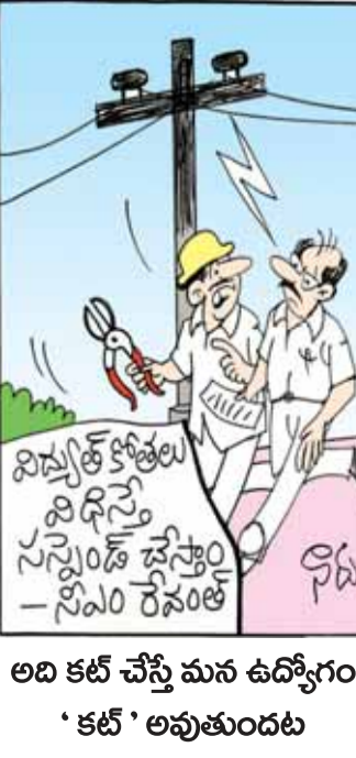
అది కట్ చేస్తే మన ఉద్యోగం 'కట్' అవుతుందట