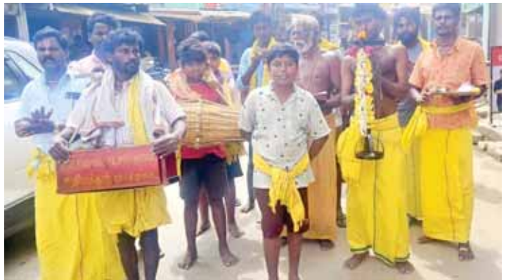
పాదయాత్ర ద్వారా తిరుమలకు వెళుతున్న భక్తులు