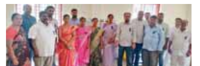
నిరసనలో పాల్గొన్న ఉద్యోగులు

చౌడపల్లి, మేజర్ న్యూస్: మండలంలోని పంచాయతీ రాజ్ శాఖ వారు తమ సమస్యల పరిష్కారము కొరకు తమ శాఖ జే.ఎ.సి పిలుపు మేరకు తమ శాఖ పరిధిలో గల ఉద్యోగిస్తులు అందరూ నల్లబ్యాడ్జిలతో నిరసన వ్యక్తం చేశారు. ప్రభుత్వం వారు ఎంటనీ మా డిమాండ్లను పరిష్కారం చేయాలని కోరారు. పంచాయతీ కార్యదర్శులు, సచివాలయ సిబ్బంది, మండల పరిషత్ సిబ్బంది పాల్గొన్నారు.