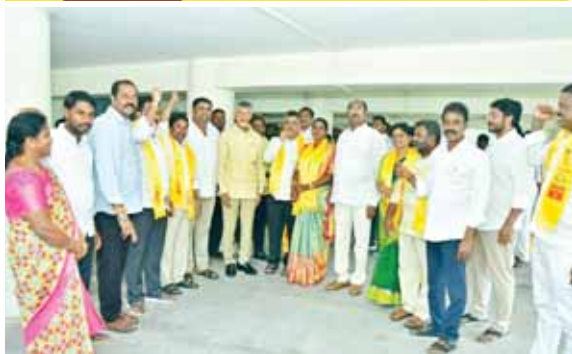
చంద్రబాబు సమక్షంలో తెలుగుదేశం పార్టీలో చేరిన వైకాపా జడ్పీటీసీలు