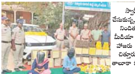
స్వాధీనం చేసుకున్న, మద్యం, నిందితులను మీడియా ముందు హాజరు పరిచిన చిత్తూరు ఈస్ట్ తాలూకా పోలీసులు