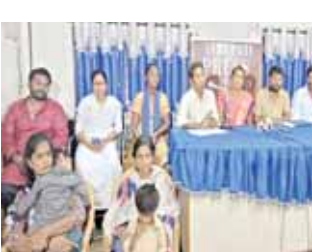
మాట్లాడుతున్న పోరాట కమిటీ సభ్యులు

అధికారుల నిర్లక్ష్యంతోనే భూ కబ్జా అవతారం.... పేదలందరికీ ఇళ్ల స్థలాలు మంజూరు చేసే వరకు మ పోరాటం ఆగదు