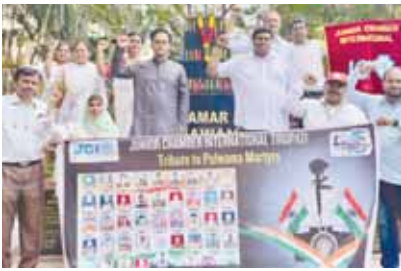
అమరవీరులకు నివాళులు అర్పిస్తున్న దృశ్యం