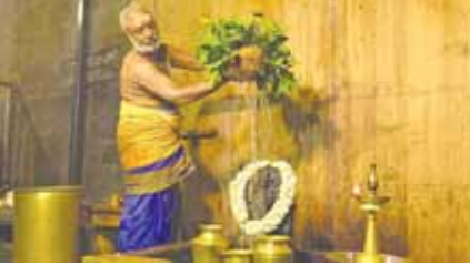
శనీశ్వరునికి అభిషేకం చేస్తున్న అర్చకులు

శ్రీకాళహస్తి, మేజర్ న్యూస్: శ్రీకాళహస్తి శ్వర స్వామి దేవ స్థానంలో శనివారం శనీశ్వర స్వామి అభిషేకం వైభవంగా నిర్వహించారు. ఈ కార్యక్రమానికి భక్తులు హాజ రై శనీశ్వర స్వామిని దర్శించుకున్నారు.