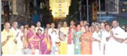
గోవింద నామ సంకీర్తనలు చేస్తున్న దృశ్యం