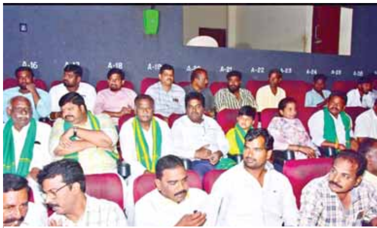
రాజధాని పైల్డ్ సినిమాను వీక్షిస్తున్న జి జే యం, ఇతర తెలుగుదేశం నాయకులు.

సంఘాల నాయకులు పెద్ద సంఘాలు పాల్గొన్నారు.