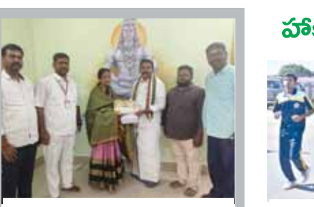
విరాళాన్ని అందచేస్తున్న దాతలు