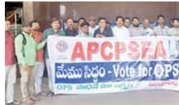
నిరసన వ్యక్తం చేస్తున్న దృశ్యం