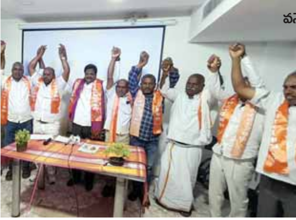
తిరుపతి ఎడ్యుకేషన్, మేజర్ న్యూస్: వైఎస్సార్ సిపీ అధినేత, రాష్ట్ర ముఖ్యమంత్రి వైఎస్ జగన్మోహన్ రెడ్డి వన్నెకుల క్షత్రియ సామాజిక వర్గం వారిని పిలిచి గౌరవాన్ని కల్పించారని, తమ సామాజిక వర్గ ఓట్లను