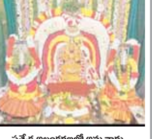
ప్రత్యేక అలంకరణలో అమ్మవారు