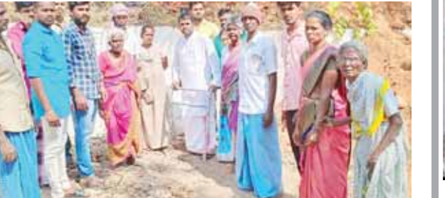
వివరాలను వెల్లడిస్తున్న బాధితులు

కార్వేటి నగరం, మేజర్ న్యూస్ :కార్వేటి నగరం ప్రభుత్వ డిగ్రీ కళాశాల సమీపంలో ఉన్న దళితల కుటుంబాలు నివసిస్తూ జీవనం సాగిస్తున్నారు. అయితే నివసిస్తున్న ప్రదేశంలో డిగ్రీ కళాశాల ప్రహారీ గోడ నిర్మిస్తున్నారు, మధ్యలో నిర్మాణం చేపట్టడం వల్ల దారి లేకుండా ఇబ్బంది పడతారని గంగాధర్ నెల్లూరు నియోజకవర్గ జనసేన నియోజకవర్గ బాధ్యులు పొన్న యుగంధర్ బాధ్యతలు తక్కువే నిలిపివాలని డిమాండ్ చేశారు. ఈ సందర్భంగా ఆయన మాట్లాడుతూ నిరుపేదలకు న్యాయం చేయాలని మనవిగడప గడప కార్యక్రమంలో ఉపముఖ్యమంత్రి నారాయణస్వామి కళాశాలకు ఆసుకొని ఉన్న బాట్రూం పక్కనే కాంపౌండ్ వాల్ నిర్మించాలని అధికారులకు ఆదేశం.స్థానిక వైసీపీ నాయకులు ఆయన ఆజ్ఞను బేకాతరు చేసి నిరుపేదలకు అన్యాయం చేస్తున్నవైనం, జనసేన పార్టీ దీన్ని తీవ్రంగా ఖండిస్తోంది. నిరుపేదలకు న్యాయం జరిగే గంతువరకు ప్రజల పక్షాన పోరాటానికి సిద్ధం కళాశాల అభివృద్ధికి మేము ఆటంకం కాదు.దళితులు జనసేన నాయకులు పాల్గొన్నారు.