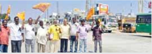
అంబేద్కర్ విగ్రహం వద్ద నిరసన తెలుపుతున్న తెలుగుదేశం శ్రేణులు

గుడిపాల, మేజర్ న్యూస్: అనంతపురం రాష్ట్రం సభలో ఆంధ్రజ్యోతి ఫోటో గ్రాఫర్ పై జరిగిన దాడికి వ్యతిరేకంగా మండలంలోని జర్నలిస్టులు మంగళవారం నిరసన వ్యక్తం చేసిన సందర్భంగా తెలుగు