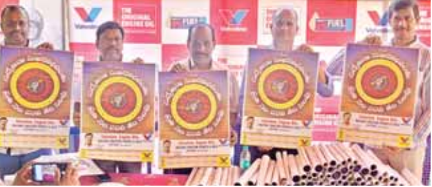
శ్రీచర్లను విడుదల చేస్తున్న దృశ్యం