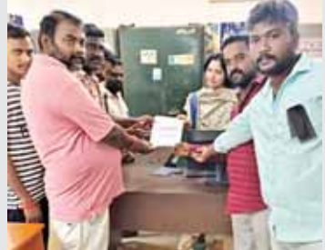
డిప్యూటీ తహశీల్దార్ కి వినతిపత్రం ఇస్తున్న జర్నలిస్టులు