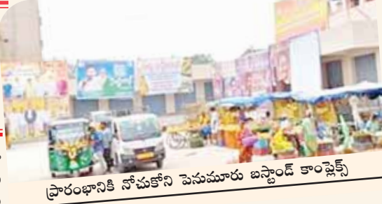
ప్రారంభానికి నోచుకోని పెనుమూరు బస్టాండ్ కాంప్లెక్స్

మండల ప్రజల కల నెరవేరేనా ఎన్నికల కోడ్ కూసేవేళ అయినా ప్రారంభానికి నోచుకుని మండల కాంప్లెక్స్ అవస్థల్లో ప్రయాణికులు అవస్థలు పడుతూ ఉన్న... పట్టించుకునే నాధుడే కరువయ్యాడు. మండల కేంద్రంగా పెనుమూరులో ఏళ్ల తరబడి సమస్యగా మారిన బస్టాండ్ స్థలంలో కాంప్లెక్స్ నిర్మాణం అధికార పార్టీ నాయకులు ఎట్టకేలకు చేపట్టారు. ఒక కోటి..17 లక్షల రూపాయలతో నిర్మాణ పనులు చేపట్టారు. పెనుమూరు మండలంలో వైయస్సార్ కాంగ్రెస్ పార్టీ ప్రభుత్వ సలహాదారుడు మాజీ ఎంపీ జ్ఞానేందర్ రెడ్డి వర్సెస్. గంగాధర్ నెల్లూరు నియోజకవర్గ ఎమ్మెల్యే, రాష్ట్ర ఉప ముఖ్యమంత్రి నారాయణస్వామి వర్గీయులతో వర్గ విభేదాలతోనే పెనుమూరు మండల ప్రజల ఎన్నో ఏళ్ల కల నిరాశగా మిగిలిపోయే దుస్థితిలో బస్టాండ్ కాంప్లెక్స్ పనులకు ఆటంకాలుగా ఏర్పడిందని పలువురు వాపోతున్నారు. అయితే పెనుమూరు వైఎస్ఆర్ కాంగ్రెస్ పార్టీ వర్గ విభేదాల కారణంగా నిర్మాణం పూర్తయినా ప్రారంభానికి నోచుకోలేకపోయింది. బస్టాండ్ కాంప్లెక్స్ నిర్మాణ పనులు చేపట్టిన కాంట్రాక్టర్లకు ప్రభుత్వం నుండి రూ.కోటి 17 లక్షల రూపాయలకు గాను ఒక్క రూపాయి కూడా నిధులు మంజూరు కాకపోవడం తోనే ప్రారంభానికి నోచుకోలేదంటూ కాంట్రాక్టర్లు వాపోతున్నారు. అయితే వర్గ విభేదాల కారణంగా రెండు నెలల క్రితం నియోజకవర్గం ఎమ్మెల్యే నారాయణ స్వామి వర్గీయులు కాంప్లెక్స్ పనుల్లో ఫ్లోరింగ్ పనులకు 50 లక్షల రూపాయలతో ఫ్లోరింగ్ పనులు చేపట్టారు. పనులు జరిగే