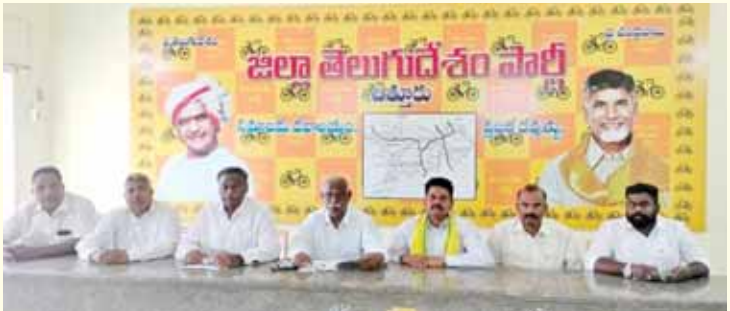
హర్ష వ్యక్తం చేస్తున్న టీడీపీ జిల్లా నాయకులు