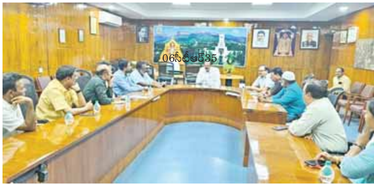
06 సీట్ల ఆర్ 35