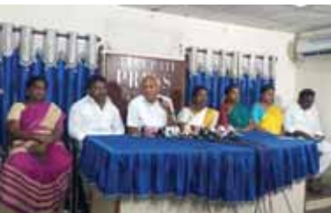
కేంద్ర మాజీ మంత్రి డాక్టర్ చింతామోహన్

తిరుపతి సిటీ మేజర్ న్యూస్ : కాంగ్రెస్ అధికారంలోకి వస్తే తిరుపతిని రాజధానిగా చేస్తామని అంతేకాకుండా ఏ పార్టీ అధికారంలోకి వచ్చిన తిరుపతిని రాజధానిగా చేయామని మాజీ ఎంపీ చింతామోహన్ ఆకాంక్షించారు. తిరుపతి ప్రెస్ క్లబ్ లో మంగళవారం ఏర్పాటు చేసిన విలేకరుల సమావేశంలో డాక్టర్ చింతామోహన్ మాట్లాడారు. మాజీ రాష్ట్ర ముఖ్యమంత్రి చంద్ర బాబు నాయుడు ప్రస్తుత రాష్ట్ర ముఖ్యమంత్రి జగన్మోహన్ రెడ్డిలను వారి వైఖరిని తెలుపమని ఆయన డిమాండ్ చేశారు. రాయలసీమ అభివృద్ధి చెందాలంటే తిరుపతి రాజధానిగా చేయాలని ఆయన తెలిపారు. అందుకు కావలసిన సమగ్ర పరిస్థితులు తిరుపతికి నెలకొని ఉన్నాయని ఆయన