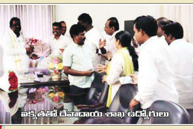
పక్కతీటి దేవదాయ శాఖ ఉద్యోగులు