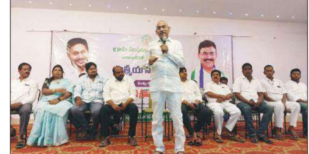
రాజ్యంగబద్ధంగా అమలు చేస్తే వివిధ స్థాయి లభింపాలని వరకు వాటి ఫలితాలు అంది అనుకున్న లక్ష్యం నెరవేరుతుందని మంత్రి పేర్కొన్నారు. సంస్కరణలో ఆనాడు జ్యోతిరావు పూలే సావిత్రిబాయి పూలే స్త్రీ విద్య కారకు ఎనలేని కృషి చేయడం వాటి యొక్క సత్యలితాలు నేడు కనపడుతున్నాయి అన్నారు. సంస్కరణలో భాగంగా విద్య కు అత్యంత ప్రాధాన్యతను ఇస్తూ మన విద్యార్థులు దేశంలో ఎక్కడికి వెళ్లినా ప్రతిభను కనబరిచే ప్రాథమిక విద్య నుంచే ఇంఫోమ్ మీడియం, ఆరోగ్యానికి సంబంధించి జగన్నన్న గౌరముద్ద, పాఠశాల అభివృద్ధి, జగన్నన్న విద్యా కానుక, ఫీజు రీయంబర్స్ లో, బాల కార్మిక వ్యవస్థ