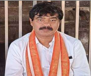
తెనాలి, మేజర్ న్యూస్: మాజీ మంత్రి కన్నా లక్ష్మి నారాయణపై పల్లారు జిల్లా ముప్పాళ్ల మండలం,