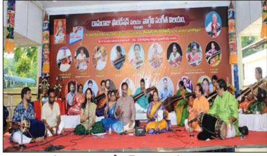
గుంటూరు (సాంస్కృతికం) మేజర్ న్యూస్ : స్థానిక బృందావన గార్డెన్స్ శ్రీ వేంకటేశ్వరస్వామి ఆలయ