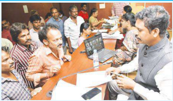
అర్జీదారులను చూసి స్పందించిన కలెక్టర్