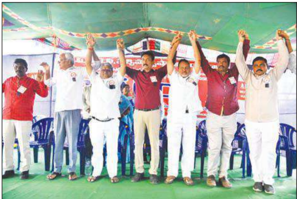
గతంలో అంగీకరించిన డిమాండ్ల అమలులో అతీ గతీలేదు

11 జాయింట్ స్టాఫ్ కౌన్సిల్ సమావేశాలు...చాయ్, బస్కెట్లకే పరిమితం