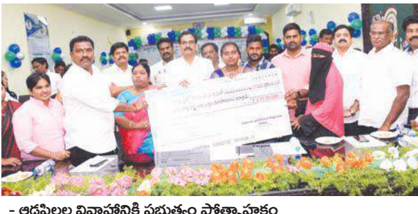
- ఆడపిల్లల వివాహానికి ప్రభుత్వం ప్రోత్సాహకం - వైఎస్సార్ కళ్యాణమస్తు, షాద్ తోఫా నిధులు జమ చేసిన సీఎం జగన్ - 303 మంది నూతన వధూవరులకు నిధులు విడుదల