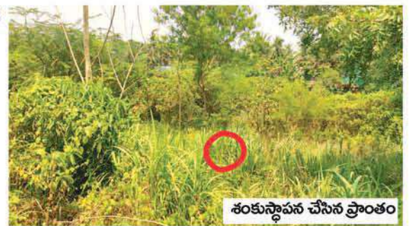
శంకుస్థాపన చేసిన ప్రాంతం