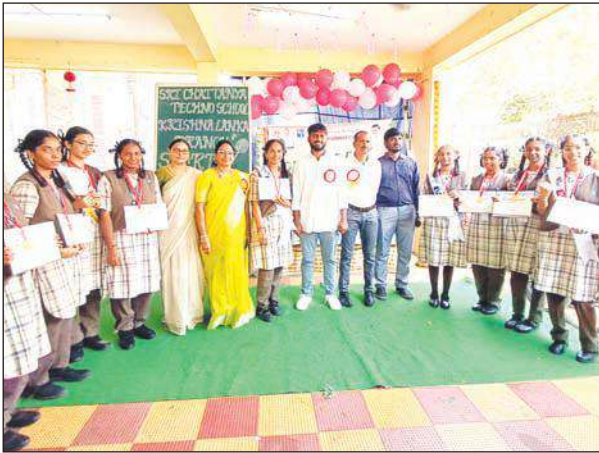
ఉత్సాహంగా ఆటలలో పాల్గొనేలా