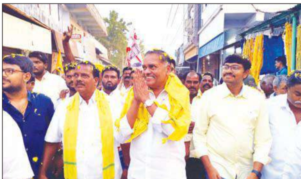
ప్రజలతో మమేకమైన మండలి (ఫైల్ ఫోటో)