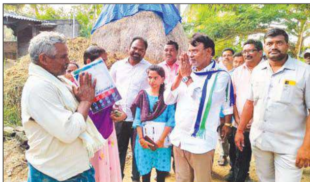
గడపగడపకి ఎం.ఎల్.ఎ సంతోషి (ఫైల్ ఫోటో)