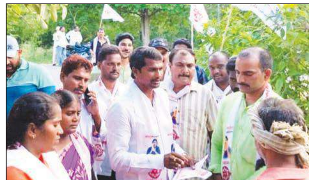
ప్రజలతో గుడివాడ (ఫైల్ ఫోటో)