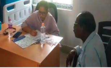
పొన్నూరు మేజర్ న్యూస్ : పొన్నూరు పట్టణంలో మంగళవారం జగనన్న ఆరోగ్య సురక్ష ఫేజ్-2