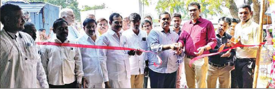
మెడికల్ క్యాంపును ప్రారంభిస్తున్న డాక్టర్లు

శ్రీ వెంకటలక్ష్మి చారిటబుల్ ట్రస్ట్ ఆధ్వర్యంలో మెడికల్ క్యాంప్ - ప్రజలకు చెకప్ తో పాటు ఉచితంగా మందులు