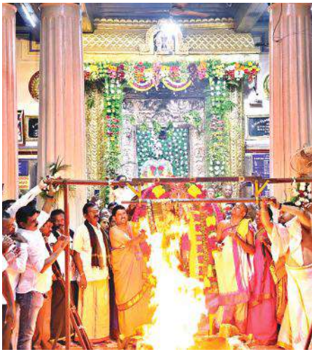
ఘనంగా వాసవి మాతా ఆత్మార్పణ దినోత్సవం