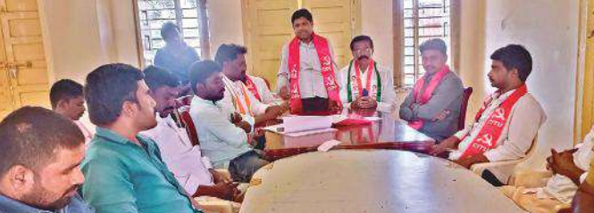
రౌండ్ టేబుల్ సమావేశంలో ఏబిఐటిసి సిఐఐ యు కాంగ్రెస్ నాయకులు