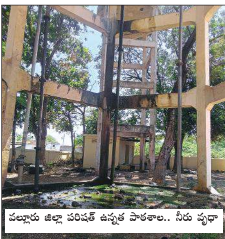
వల్లూరు జిల్లా పరిషత్ ఉన్నత పాఠశాల.. నీరు వృధా

వల్లూరు మేజర్ స్టూస్: ప్రతి ఇంటికి నీరు అందాలి అని ప్రభుత్వం అన్ని విధాల చర్యలు తీసుకుంటుంటే వల్లూరు మండలంలోని ఏ ఒకాయపల్లి అంగన్నాడి కేంద్రంలో నీరు దొరకని పరిస్థితి, మరోపక్క నీరు వృధా అయ్యే పరిస్థితి ఇది ఎవరి నిర్లక్ష్యం అని అర్థం కాని పరిస్థితుల్లో ప్రజల ఆవేదన, మండల కేంద్రమైన వల్లూరులో ప్రజలు నీటి కోసం ఇబ్బందులు పడుతున్నారు. వేసవి ప్రారంభం కాకమునుపే పలు చోట్ల దాహపు కేకలు వినిపిస్తున్నాయి. సంబంధిత గ్రామీణ నీటి సరఫరాశాఖ తమ కష్టాలు పట్టించుకోలేదని గ్రామప్రజలు తమగోడును వెళ్ళబోసు కుంటున్నారు. సాధారణంగా వేసవికాలం ప్రారంభమై దంటే దాదాపు నెలరోజులు ముందుగానే యాక్షన్ ప్లాన్ తయారు చేయడం జరుగుతుంది. ఎక్కడ కూడా నీటి కోసం ప్రజలు ఇబ్బంది పడకుండా ప్రత్యామ్నాయ ఏర్పాట్లు చేయడంలో భాగంగా ప్రణాళికలు రూపొందిస్తారు. చలికాలం ముగియ మునుపే నీటి కోసం ఇబ్బందులు పడుతున్న పరిస్థితి ఏఒకాయపల్లి గ్రామంలో కనిపిస్తుంది. ఈ గ్రామంలో అంగన్నాడి కేంద్రానికి పక్కనే గతంలో చేతిపంపు వేశారు. కొద్దికాలం పనిచేసిన తర్వాత చేతి