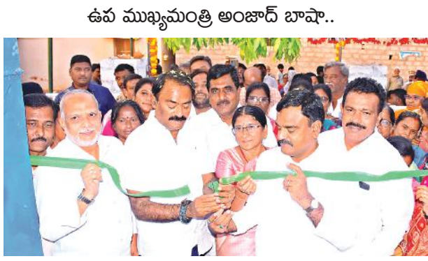
ఉప ముఖ్యమంత్రి అంజాద్ బాషా..