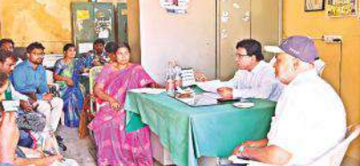
రైతు భరోసా సిబ్బంది సమస్యలపై మాట్లాడుతున్న జెడి చంద్ర నాయక్

జమ అవుతుందని ఆయన తెలిపారు. ప్రతి రైతు నుండి ఈనెల 21వ తేదీలోపు ఈ-క్రాఫ్ బుకింగ్, ఈ కేవల తప్పకుండా చేయించాలన్నారు. రైతులనుంచి ఈ కేవల ఏష యంలో క్షేత్ర స్థాయి సిబ్బంది అల సత్వం పహిస్తే కఠిన చర్యలు తప్పవని హెచ్చరించారు. రభీ, ఖరీఫ్ సీజన్లో పంట సాగు చేసిన రైతుల వివరాలు తప్పనిసరిగా రైతు భరోసా కేంద్రాల్లో పొందుపరచాలన్నారు. రైతు భరోసా కేంద్రాల్లో పనిచేసే సిబ్బంది అర్హత కలిగిన రైతులను గుర్తించి ప్రభుత్వం అందిస్తున్న సబ్సిడీ విత్తనాలను, ఎరువు