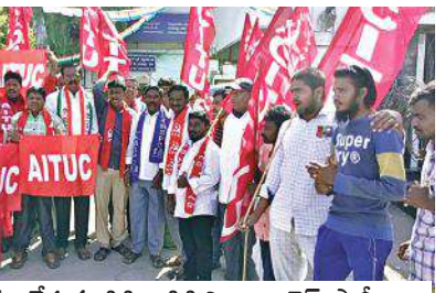
నిరసన వ్యక్తం చేస్తున్న సిపిఐ సిపిఎం కాంగ్రెస్ పార్టీలు

చేస్తుందని. మతోన్మాదాన్ని పెంచి పోషిస్తుందని వారు అన్నారు. స్వామి నాథన్ కమిటీ సిఫారసుల ప్రకారం అన్ని పంటలకు 50% మద్దతు తీసుకువచ్చి చట్టం తేవాలని. రైతుల రుణాలు మాఫీ చేయాలని కనీస వేతనం 26,000 అమలు చేయాలని ఉపాధి హామీకి కేంద్ర బడ్జెట్ లో రెండు లక్షల కోటాయించి రెండు వందల రోజులు పని దినాలు పెంచాలని వారన్నారు అదేవిధంగా పోలవరం ప్రాజెక్టుకు నిధులు కేటాయించాలని రైతుల ప్రయోజనాలకు అనుగుణంగా సుగర్ పంటల బీమా పథకం ఇవ్వాలని కృష్ణా జలాల పంపిణీలో రాష్ట్ర హక్కులు కాపాడాలని ఇన్ఫుల్ సబ్సిడీ పంటల బీమా వెంటనే ఇవ్వాలని వారు కేంద్ర రాష్ట్ర ప్రభుత్వాలను డిమాండ్ చేశారు. చుక్కల భూములకు