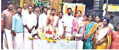
సీతారాముల స్వామికి పూజలు నిర్వహించిన గ్రామస్తులు

దువ్వూరు, మేజర్ న్యూస్ : మండల పరిధిలోని మూడిండ్ల పల్లె గ్రామంలో శ్రీ సీతారామ లక్ష్మణ హనుమాన్ సమేత ప్రథమ వార్షికోత్సవం ఘనంగా నిర్వహించారు. శుక్రవారం మూడిండ్ల పల్లె గ్రామంలో ఉదయం నుంచి పెద్ద ఎత్తున మహిళలు సీతారాముల స్వాములకు అభిషేకం నిర్వహించారు. వేద పండితులచే పూజలు