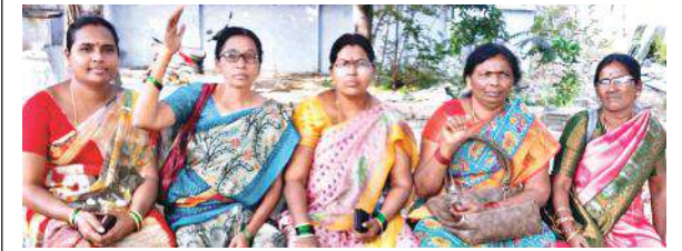
సమావేశంలో మాట్లాడుతున్న అంగన్వాడీ వర్కర్లు